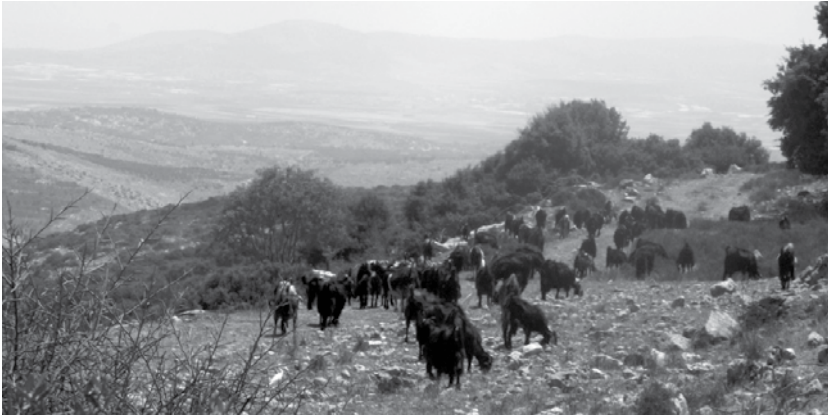
(צילום: ד' שניאור)

באיורים של סיפור יוסף ואחיו בספרי ילדים 5 ניתן לראות שהרקע של המרחב הוא מדברי-צחיח, בעל קרקע חולית וצמחיה המאפיינת מדבר. כאמור, התיאור הזה שונה מהנוף האמיתי של עמק דותן, הכולל אדמה פורייה שבה ניתן לעסוק בחקלאות לצד רעיית צאן (איור מספר 3).