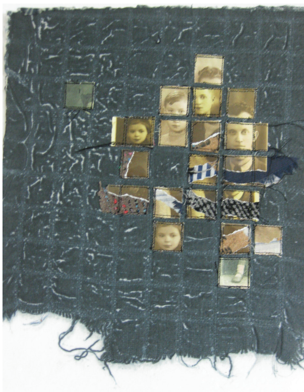
4. שולמיית לוין, בעקבות, 2015, דפי כותנה עבודת יד, הדפסת צבע, רקמת יד ומכונה, מידות כל דף 23x28 ס"מ.

עדות או עקבות המעידים כי פעם הם היו כאן". 19 אחת העבודות הבולטות היא "בעקבות" (תמונה 4) שנמצאת בספר בן 22 דפים שיצרה לבנה הבכור והוצגה בתערוכה "ספר אמן; טבע / עצמי" בשנת 2015. 20 לוין לקחה תצלום של משפחתה לפני המלחמה שבו נראים הוריה, אחיה והיא (תמונה 5). את הדמויות של הוריה ואחיה שנספו היא מפרקת לחתיכות ומטביעה בתוך הבד, והצופה נדרש לעשות מלאכת הרכבה של הדמות. משטח הבד וקווי שתי וערב יוצרים מערך מפורק קובייתי. את דמותה שלה - של האמנית - היא משאירה פנים שלמות בקובייה אחת וחוזרת עליה פעמיים: פעם אחת בקרבה אל שאר בני המשפחה, ופעם שניה למטה רחוק מהם, כאילו משאירה עצמה לבד בתוך המרחב התחתון של החיים שהם לא מצויים בו.