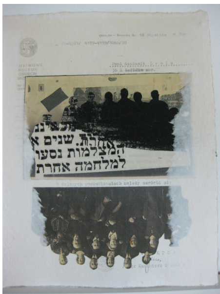
6. שולמית לויך, בעקבות, 2015, דפי כותנה עבודת יד, הדפסת צבע, רקמת יד ומכונה, מידות כל דף 23x28 ס"מ.

בעבודה אחרת באותו ספר יצקה לויך בתוך דף הכותנה מסמך אותנטי ממוזיאון אושוויץ הכתוב בפולנית וממוען אליה (תמונה 6). המסמך נותר אצלה, זכר לשנים שבהן ניסתה למצוא את עקבות הוריה. היא פנתה למוזיאון אושוויץ כדי לחפש אם הוריה היו שם ולא נמצא דבר. על רקע המסמך נראה צילום משפחתי מרובה משתתפים שנלקח מטקס האירוסין של הוריה. לויך הפכה את התצלום כך שהדמויות מופיעות עם הראש כלפי מטה, "כאילו בארמה", ולמעלה נותרה הצללית השחורה שלהם. כל בני המשפחה נספו והעבודה מייצגת את "האובדן הגדול, את החור הענק שאתה הולך איתו לאורך כל חיך". 21