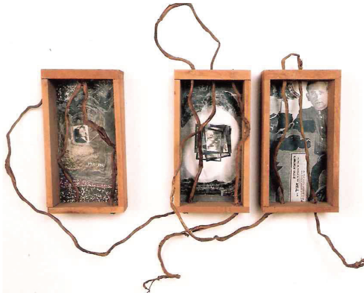
1. ישראלה הרגיל, קשרים בין שלוש המסגרות, ספתח (אב, בת, אם), 2007 בקירוב, אוסף המוזיאון לאמנות יד ושם.

בשנת 2007 הציגה הרגיל לראשונה תערוכה אישית בנושא אוטוביוגרפי. על קיר הכניסה הציבה מה שהיא מכנה "מגירות או ארגזי זיכרון" (תמונה 1) שתוחמים בתוכם אובייקטים בטכניקה של קולאז'. בכל מסגרת-מגירת זיכרון נמצא תצלום של בן משפחה מתקופת המלחמה. בין המסגרות יצרה הרגיל חיבור מפותל בין מסגרת האב, מסגרת הבת ומסגרת האם. את החיבור היא מכנה "שורשי אוויר". שנה לפני כן השתמשה הרגיל במושג "שורשי אוויר" בתערוכה הנושאת שם זה בהיכל התרבות בפתח תקווה (2006), וכך היא כותבת שם: "שורשי אוויר הם שורשים שמתרגים על פני האדמה בחיפוש אחר מים וחמצן. אילו ניחנו בעיניים חודרניות ובוחנות היינו יכולים להבחין בנוזלים ובמלחי המזון הזורמים בהם ולהבחין בזיהום שפשה באוויר, במים ובקרקע. האם העץ היבש שניצב בטבורה של התערוכה "שורשי אוויר" ולו צינורות גמישים להזרמת אוויר במקום שורשים - ישוב ללבלב? נראה שגם בו, כמו בנו, מוטבע געגוע לטבע הירוק, לטבע ההולך ונכבש, ההולך ונכחד". 9 בתערוכה פוטוארוזיה לוקחת הרגיל את המושג הלקוח מעולם הטבע ושימש אותה בתערוכה לאמירה סביבתית כדי לאפיין את הקשר בינה לבין הוריה: "שורשי אוויר הם שורשים שנשלחים על פני האדמה אצל צמחים מסוימים. הם משתרגים לאורך מטרים רבים ומעבירים מזון ומים. החיבור המפותל בין שלושתנו, האב, הבת והאם נעזר בשורשי האוויר כדי להצביע על הקשר המורכב שבין שלוש הדמויות". 10