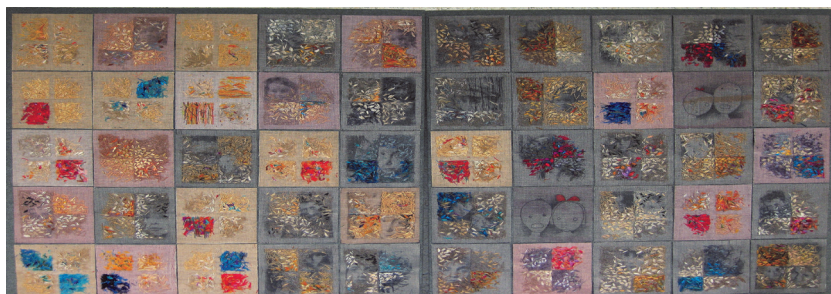
3. שולמית לויין, דולק היה כאן... , 2010, רקמה ידנית, רישום, הדפס. שתי יחידות, מידות כל יחידה 80x80 ס"מ. חומרים: בד פשתן, בד צמר, אורגנזה, חוטי כותנה, חוטי צמר ומשי.

ב-2010 הכינה לויין את העבודה "דולק היה כאן" (תמונה 3). העבודה הוצגה בפולין ב-2014 והוקדשה לזכר אחיה דולק - כינוי חיבה לגדליהו - שהיה בן ארבע וחצי כשנרצח. הוריה לא הצליחו למסור אותו מפני שהיה נימול. לויין לא מצליחה לזכור אותו, ולכן לוקחת תצלומים שונים שלו ומשבצת ורוקמת פנימה את דמותו אל בד הפשתן המתוח על קרטון. כאמנית סיב, לויין פועלת בתחום ה"קראפט", כלומר יצירה שמבוססת על מיומנות אישית ידנית עמלנית. היום, בשל העניין הגובר במחזור וקיימות, תחומי הקראפט המסורתיים כמו אריגה, תפירה וקליעה נמצאים במוקרי פעילות חדשים. 17 בכל ריבוע מודפסת דמותו של ילד - אחיה או דמותה או ילדים אחרים מתקופת השואה. "שנינו קיבלנו שמות עבריים אף שנולדנו בפולין. הכול מוסתר. נמצא מאחורי הקלעים. דולק היה כאן. הוא באמת היה כאן. אני תמיד עם סרט. זה האבסורד. מלחמה פצצות, הורגים, רוצחים, אבל סרט חייב להיות על הילדה". 18